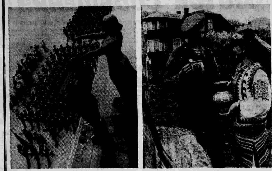
◆ Мы этой памяти верны. (Мемориал Славы во Львове). ◆ У криницы.