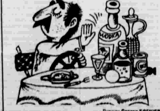
Рисунки Сергея БОГАЧЕВА.

Учредитель — журналистская организация «Правда»