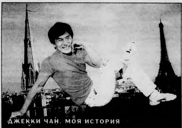
ДЖЕККИ ЧАН. МОЯ ИСТОРИЯ

“КАПРИЗЫ РЕКИ”. Историческая драма. В африканскую колонию Франции приезжает новый королевский наместник Жан Франсуа, посланный за дуэли и любовные похождения. И здесь, в Африке, он остается верен себе. Его новая пассия — молодая негритянка... Режиссер — Бернар Жиро. В ролях: Тьерри Фремон, Р. Бланш, Р. Биллер, Э. Соу. Франция. (Воскресенье, 23 апреля, 0.55).