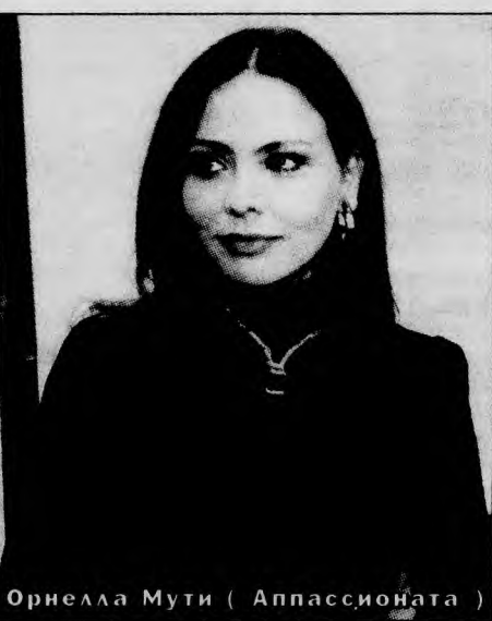
Орnella Мути (Аппассионата)