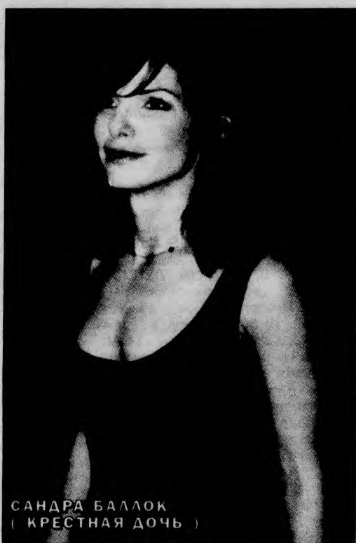
САНДРА БАЛЛОК (КРЕСТНАЯ ДОЧЬ)