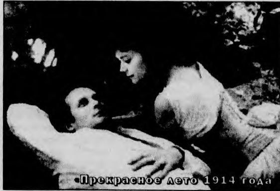
«Прекрасное лето 1914 года»

НОЕ ЛЕТО 1914 ГОДА". Экранизация романа Луи Арагона "Пассажиры империи". Несколько аристократических французских семей продолжают в канун мировой войны жить своей обычной жизнью. Режиссер — Кристиан де Шалонж. В ролях: Ипполит Жирардо, Юдит Анри, Мариан Демиччи. Франция, 1996 г. (Пятница, 21 апреля, 22.05). "РЕБЕНОК ПО ИМЕНИ ИИСУС". Четырехсерийная драма о первых годах жизни Иисуса Христа. Между римлянами и иудеями — война. Спасаясь от преследований царя Ирода, Мария с мужем и младенцем покидает свое жилище в Вифлееме... Режиссер — Франко Росси. В ролях: М. Белини, П. Клементи. Италия, 1994 г. (Суббота—воскресенье, 22—23 апреля, 14.45). "ПОЙДЕМ СО МНОЙ". Прямо на похоронах мужа к новоиспеченной вдове Мейбл возвращаются экстраординарные способности. Режиссер — Джоан Вудворд. В ролях: Эстелла Парсонс, Сильвия Сидни. США. (Суббота, 22 апреля, 23.25). "ЕВРОПА". 1945 год. Фашизм разгромлен. Американец немецкого происхождения возвращается в Германию и вступает в ряды борцов за "германскую идею" — "юношей-волков". Сюрреалистический триллер Ларса фон Триера. В ролях: Макс фон Сюдов, Барбара Зукова, Л. фон Триер. Дания—Франция—Германия—Швеция, 1991 г. (Воскресенье, 23 апреля, 22.20).