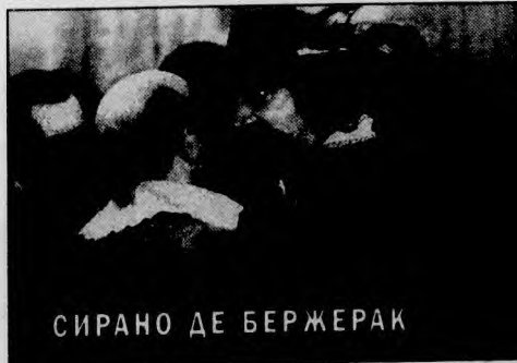
СИРАНО ДЕ БЕРЖЕРАК

"СИРАНО ДЕ БЕРЖЕРАК". Фильм Ж.-П. Раппно по одноименной пьесе Э. Ростана получил девять "Сезаров" и один "Оскар" (за костю-