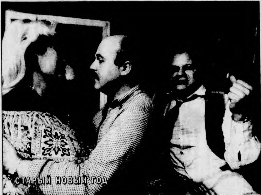
СТАРЫЙ НОВЫЙ ГОД