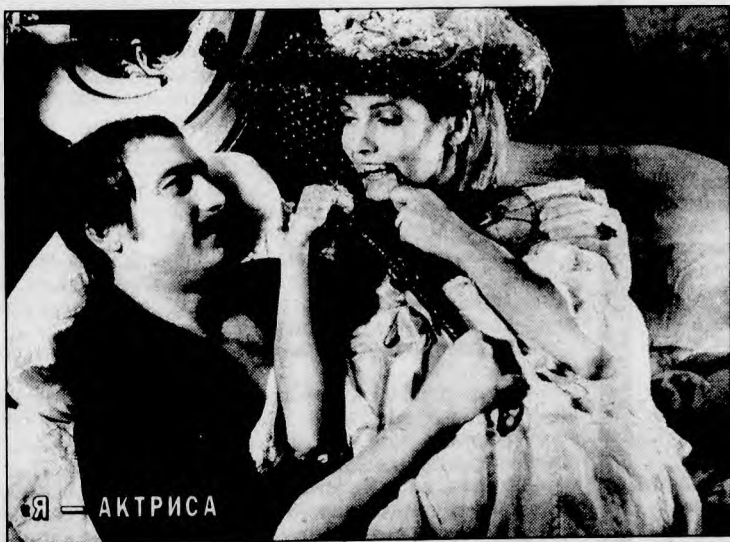
Я — АКТРИСА

«ЗАХОЧУ — ПОЛЮБЛЮ». Женщина красивая и умная была рано выдана замуж за богатого. Она лишена предрассудков, среди ее поклонников и возлюбленных — юноша революционер наряду со стареющим художником... По мотивам повести В. Брюсова «Последние страницы из дневника женщины». «Мосфильм», 1990 г. (Воскресенье, 19 января, 20.20.)