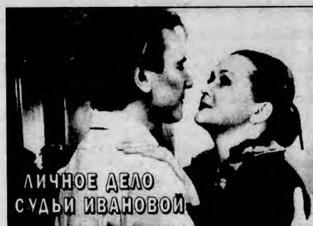
Пельцер. К/ст. им. М. Горького, 1985 г. (Пятница, 17 января, 11.20).

«ЛИЧНОЕ ДЕЛО СУДЬИ ИВАНОВОЙ». Героиня психологической драмы Любовь Иванова разводила немало пар. Обычное явление в своей практике она воспринимала равнодушно, пока муж не полюбил другую. Мучаясь, ревнуя, судья Иванова поняла, как нелегка порой жизнь и сколь запутанны бывают обстоятельства, казавшиеся ей совершенно простыми. Взаимоотношения в семье судьи показаны через восприятие ее дочери-подростка. Режиссер — И. Фрезз-младший. В ролях: О. Датская, Н. Гундарева, С. Шакуров, Т.