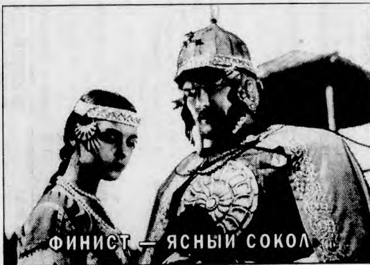
ФИНИСТ — ЯСНЫЙ СОКОЛ