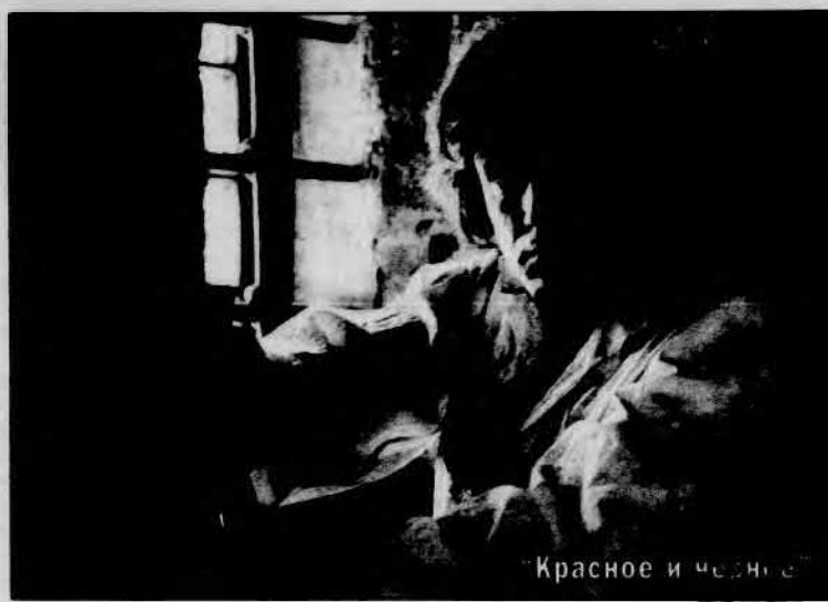
Красное и черное

"ВОСПОМИНАНИЯ ДВУХ МОЛОДЫХ ЖЕН" . Одна — провинциальная простушка, другая — искушенная парижанка. У каждой из них свой идеал счастья, но оказывается, что обе женщины мечтают об одном и том же. По произведениям Оноре де Бальзака. Режиссер — М.Кравене. В ролях: Ф.Ардан, М.Шевалье. Франция, 1980 г.