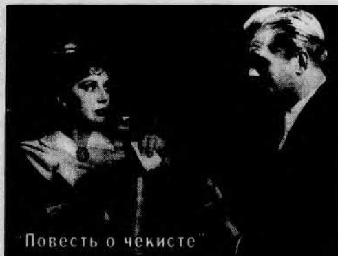
Повесть о чекисте