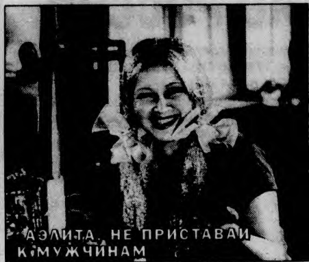
АЭЛИТА. НЕ ПРИСТАВАЙ К МУЖЧИНАМ