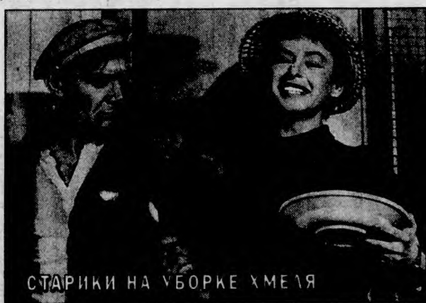
СТАРИКИ НА УБОРКЕ ХМЕЛЯ