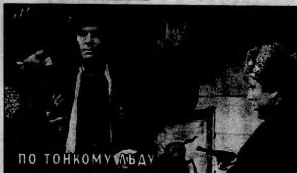
ПО ТОНКОМУ ЛЬДУ

шили деньги. Он бросился за грабителем, но через минуту наткнулся на его труп. Теперь Алекс — главный подозреваемый... Режиссер — Д. Макбрайд. В ролях: Р. Аркетт ("В поисках Сьюзен", "Голубая бездна"), С. Дорфф, К. Андерсон, Д. Литтлоу. США, 1992 г. (Пятница, 28 августа, 0.30).