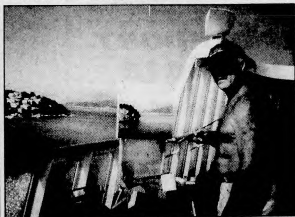
Автор фильма «Россия, которую мы потеряли» — Станислав Говорукин на этюдах.

«СЕМЕЙНЫЙ БИЗНЕС». Молодому человеку не дают покоя «лавы» его отца, бывшего преступника, и деда с богатым криминальным прошлым. Он разрабатывает план ограбления института. Фильм С. Люмета. Отличная игра актеров Д. Хоффмана, Ш. Коннери, М. Бродерика. США, 1989 г. (Воскресенье, 9 ноября, 18.45).