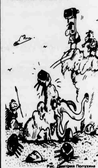
Рис. Дмитрия Попухина

ства. 15.20 Телемагазин "Спасибо за покупку!". 15.40 Сериал "ПРОСТО МА- РИЯ". 16.25 Мультсериал "Голово- кружительные приключения Билли и Теда". 13-я серия. 16.55 Сериал для подростков "ГОТОВЫ ИЛИ НЕТ". 17.25 Диск-канал. 18.00 ТСН-6. 18.20 Дорожный патруль. 18.30 Юмористический сери- ал "ГРЕЙС В ОГНЕ II". 18.55 Сериал "ДИНАСТИЯ II. СЕМЬЯ КОЛБИ". 20.00 Новости дня. 20.30 Ток-шоу "Я сама": "Это твоя проблема, дорогая...". 21.30 В мире людей. 22.00 Сериал "ЗОВ УБИЙ- ЦЫ": "ИГРА В ПРЯТКИ". 22.55 Дорожный патруль. 23.10 Шесть новостей дня. 23.15 Те Кто. 23.30 Диск-канал. 0.05 Дэвид Духовны в сери- але "ДНЕВНИКИ КРАСНОЙ ТУФЕЛЬКИ". 0.35 Юмористический сериал "ГРЕЙС В ОГНЕ II".