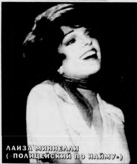
ЛАЙЗА МИННЕЛЛИ (...ПОЛИЦЕЙСКИЙ ПО НАЙМУ...)

“ИМПРОВИЗАЦИЯ”. Саксофонист Гарри Баранский от хронического безденежья решил на кражу — вынес роскошный витраж из дома умершего богача. И вдруг вспомнил, что хорошо знал покойного — страстного поклонника джаза... Режиссер — Фредерик Кинг Келлер. В ролях: Патрик Даффи, К. Хайланд, Р. Аррантс. США, 1983 г. (Понедельник, 19 июня, 23.05).