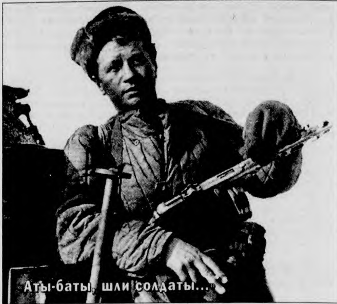
Аты-баты, шли солдаты...

“ОТЯД”. Война застигла семерых советских солдат на пустынной лесной дороге, отрезала от приграничного гарнизона. Без продовольствия, без оружия они пробивались по оккупированной фашистами территории к своим... Режиссер — Алексей Симонов. В ролях: А. Феклистов, С. Гармаш, Д. Брусникин, М. Морозов, А. Песков. Литовская к/ст., 1984 г. (Суббота, 24 июня, 12.00).