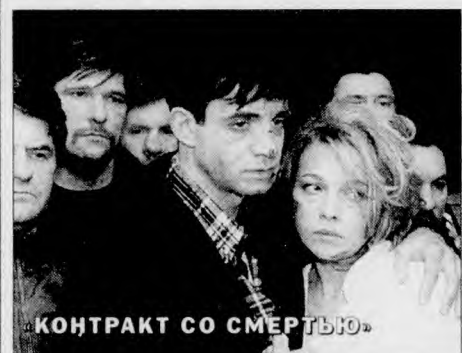
“КОНТРАКТ СО СМЕРТЬЮ”