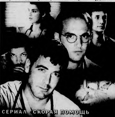
СЕРИАЛ «СКОРАЯ ПОМОЩЬ»