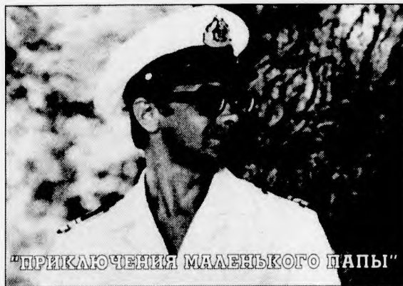
“ПРИКЛЮЧЕНИЯ МАЛЕНЬКОГО ПАПЫ”

смогла сняться в хорошем фильме”, — вздыхает она не первый год.