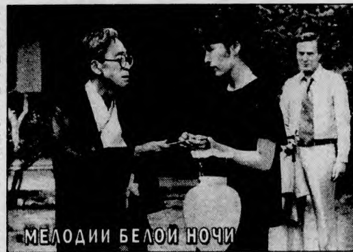
МЕЛОДИИ БЕЛОЙ НОЧИ

"ЗЕЛЕНЫЙ ЛУЧ" . Мастер изысканных психологических фильмов ("Колено Клер") режиссер Эрик Ромер, рассказывая о путешествии девушки в поисках своего идеала мужчины, верен себе. Диалоги, взаимоотношения героев полны философской глубины при внешней легкости и импровизационности. В главной роли — Мари Ривьер. Франция, 1986 г. (Воскресенье, 5 июля, 1.15).