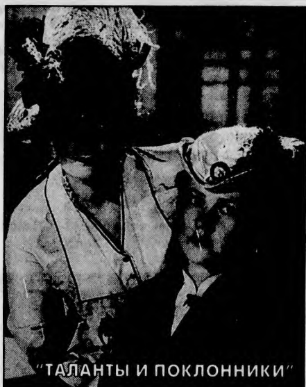
"ТАЛАНТЫ И ПОКЛОННИКИ"

"ЧЕРНЫЙ КРУИЗ". Документальная лента рассказывает об одной из крупнейших катастроф злополучного "чернобыльского" года: гибели "советского "Титаника" — теплохода "Адмирал Нахимов", затонувшего после столкновения с сухогрузом. Исследование обстоятельств трагедии, унесшей жизни нескольких сот человек, было проведено с помощью съемок, сделанных водолазами во время спасательных работ. Случившееся позволило собрать и ценнейший материал о поведении людей, оказавшихся в экстремальной ситуации.