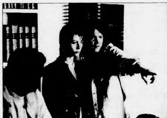
"Осторожно, двери закрываются".

ган обрубил канаты — и роскошный плавучий ресторан с клиентами на борту оказался в ночном море. Современная сатирическая комедия дебютанта-режиссера В. Кузнецова. В ролях: Л.Зайцева, А.Кузнецов, В.Талызина, И.Розанова, В.Кашпур, В.Борцов. Россия, 1990 г. (Четверг, 4 марта, 21.45). "ИЩИТЕ ЖЕНЩИНУ". Если бы не мадемуазель Алиса, страстная поклонница детективного жанра и давняя знакомая инспектора Грандена, убийство, происшедшее в нотариальной конторе, где она служит, так бы и не было раскрыто... Комедия А. Суриковой разыграна актерами С. Чиаурели, Л. Ку-