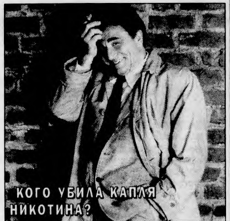
КОГО УБИЛА КАПЛЯ НИКОТИНА?

«КОГО УБИЛА КАПЛЯ НИКОТИНА?» ...выясняет знаменитый мастер распутыва-