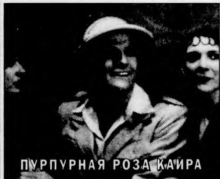
ПУРПУРНАЯ РОЗА КАИРА

«КОПЕЛИЯ». Телефильм-балет на музыку Л. Делиба. Постановка театра «Русский балет» под руководством В.