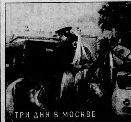
ТРИ ДНЯ В МОСКВЕ

"ОМЕНИ-И" . Первый фильм трилогии ужасов об Антихристе, режиссера Р. Доннера ("Супермен", "Убийцы", "Мэверик"). Ребенок американского посла окутан тайной. В доме начинают происходить зловещие события... В ролях: Грегори Пек, Ли Ремик, Д. Уорнер, Б. Уайтлоу. США, 1976 г. (Воскресенье, 6 сентября, 22.00).