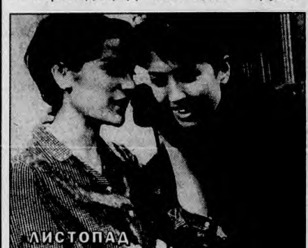
фильм, 1966 г. (Суббота, 5 сентября, 22.55).

«ЛИСТОПАД». Герой поэтической киноповести О. Иоселиани — честный, порядочный парень Нико, готовый отстаивать свои идеалы, если угодно, драться за них. В ролях: Р. Гиоргобиани, М. Карцивадзе, Г. Харабадзе, Д. Абашидзе. «Грузия-фильм», 1966 г. (Суббота, 5 сентября, 22.55).