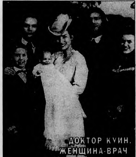
ДОКТОР КУИН. ЖЕНЩИНА-ВРАЧ

ется возвращение в эфир передачи "Перехват", которая снимается с телевизионщиками Украины.