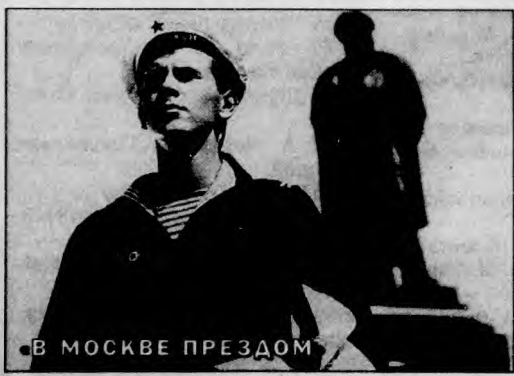
«В МОСКВЕ ПРОЕЗДОМ»

Редактор В. Верин. Н. Коротнева, Ю. Крохин, В. Спринян (заместитель редактора), Е. Тренина. Учредители: «Российская газета», коллектив газеты «Говорит и показывает Россия», ТПО «Союздетфильм». Газета зарегистрирована в Комитете Российской Федерации по печати 22 апреля 1994 года. Регистрационный № 012331. Телефон редакции: 257-58-20.