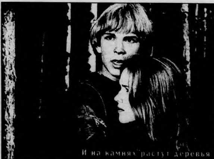
И на камнях растут деревья

«РАБА ЛЮБВИ». Полыхает гражданская война. Киногруппа, снимающая мелодраму «Раба любви», в панике бежит из «красной» Москвы. Съемки картины продолжаются в небольшом южном городке, занятом белогвардейцами. В городке работает группа подпольщиков, которой руководит оператор