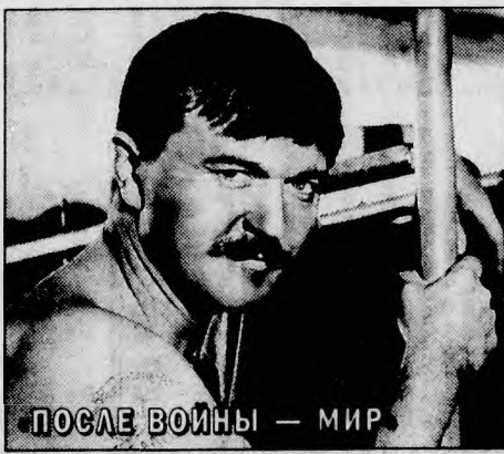
ПОСЛЕ ВОЙНЫ — МИР

40-х годов. Население небольшого шахтерского городка живет ожиданием перемен к лучшему. А между тем в городе подростки организовали борьбу с беспризорными. Опять идет война, жестокая и безжалостная. Режиссер — А.Никитин. В ролях: А.Куликов, О.Моторин, Т.Одемлюк. Россия. 1992 год. (Воскресенье, 24 августа, 20.20.)