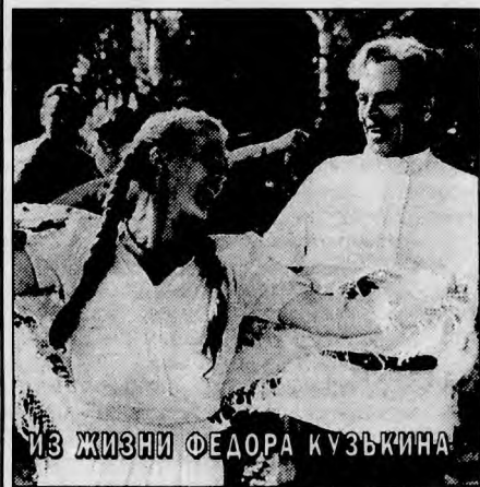
ИЗ ЖИЗНИ ФЕДОРА КУЗЬКИНА

«ИМИТАТОР». Герой черной сатирической комедии-фарса, используя телефон и недожженные способности (имитация голоса, — лишь частность), посвящает себя бизнесу. Режиссер — И. Фиалко. В ролях: И. Скляр, Н. Лапина, А. Жарков, Л. Гурченко. К/ст. им. А. Довженко, 1990 г. (Четверг, 21 августа, 21.15).