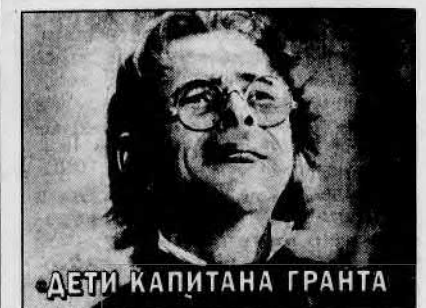
ДЕТИ КАПИТАНА ГРАНТА

«СОЛНЦЕ СВЕТИТ ВСЕМ». Война закончилась трагически для учителя истории: он потерял зрение. И лишь любовь и верность фронтовой медсестры помогли ему вновь познать радость жизни и семейного счастья. В фильме режиссера К.Воинова снимались: В.Зубков, Е.Буренков, Л.Алешникова, Т.Конюхова, Н.Сергеев. «Мосфильм», 1959 г.