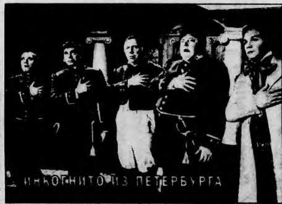
ИНКОГНИТО ИЗ ПЕТЕРБУРГА