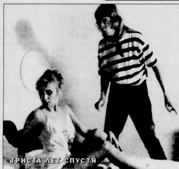
ТРИСТА ЛЕТ СПУСТЯ

“КЛАССИК”. Матерый областной “авторитет” Савицкий захватывает огромные деньги. Чтобы вернуть похищенное и наказать Савицкого, к нему посылают игрока-виртуоза по прозвищу Классик. Сергей Никоненко, Юозас Будрайтис, А. Гуськов, В. Теличкина, Л. Вележева, А. Панкратов-Черный в криминальной драме Георгия Шенгеля. Россия, 1998 г. (Воскресенье, 27 августа, 19.40).