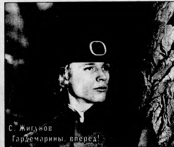
С. Жигунов Гардемарины, вперед!

"ПОХОРОНЫ". Кристофер Уокен, Изабелла Росселини, Беницио Дель Торо в криминальной драме. В семье итальянских эмигрантов, живущих в Америке, несчастье: убит младший брат. Не доверяя полиции, старшие братья сами проводят расследование, поклявшись отомстить убийцам... США, 1996 г. (Воскресенье, 13 декабря, 23.30).