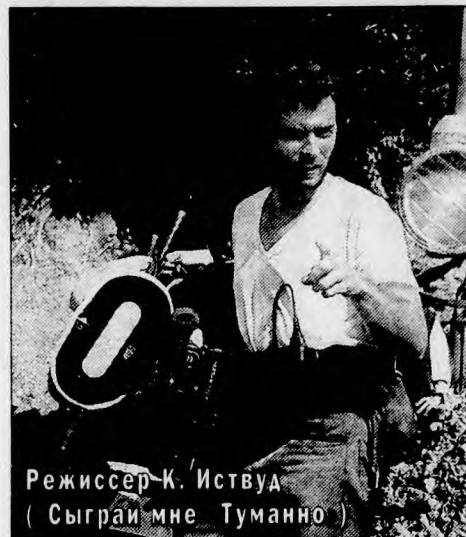
Режиссер К. Истуд ( Сыграй мне Туманно )

"ПИРАТЫ XX ВЕКА". Зрелищный отечественный боевик, за один год собравший почти 90 миллионов зрителей. В схватке с вооруженными до зубов современными пиратами советские моряки сражались до последнего