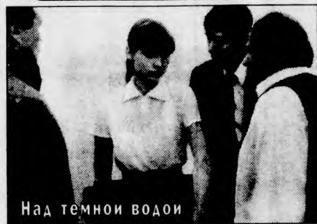
Над темной водой