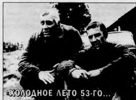
ХОЛОДНОЕ ЛЕТО 53-ГО...

Воскресенье, 3 ноября, 20.40, ОРТ (1-й канал).