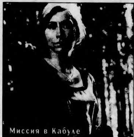
Миссия в Кабуле

человека с молодой девушкой закончился трагически: девушку убили ее бывший любовник, принадлежащий к преступной группировке. Чтобы отомстить за смерть любимой, герой вступает в неравную схватку с мафией... Франция, 1976 г.