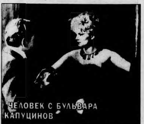
ЧЕЛОВЕК С БУЛЬВАРА КАПУЦИНОВ

«МОСКОВСКИЕ КАНИКУЛЫ». Итальянский темперамент на российской почве просто не может не породить комедийный эффект. Тем более что двадцать лет назад очень смешные «Невероятные приключения итальянцев в России» уже имели место. Может быть, поэтому в современной истории про бо-